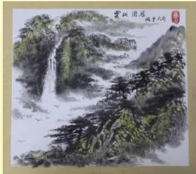
孔宪玉《云山固居》绘画类第三名